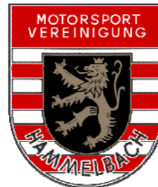
Motorsportvereinigung Hammelbach e.V. im DMV