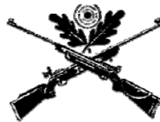
Sportschützenverein Hammelbach e.V. im DSB

(freigeschaltet vom 01.01.2009 - 31.03.2009)